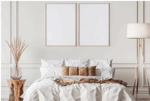
ARCHITECTURE & DÉCORATION